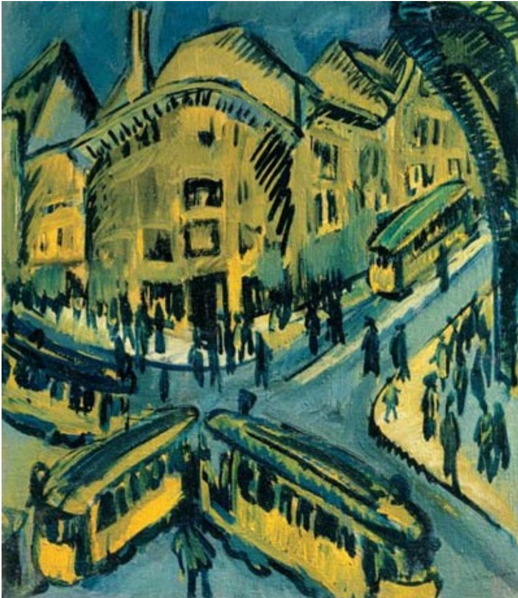
Ernst Ludwig Kirchner - Nollendorfplatz (1912)