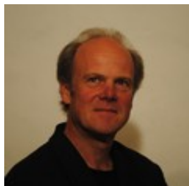
Eckhart Landes Autor

Darüber hinausgehend macht der sensible Schriftsteller apokalyptische Vorstellungen, dunkle Welten, Untergangsstimmungen und dämonisch wirkende Realität zum poetischen Bild. Das Grauenhafte ist nicht Thema, um es genüsslich auszukosten, sondern um der Absurdität des Daseins, die er im gebildeten Bürgertum der Großstädte sah, einen Spiegel vorzuhalten.